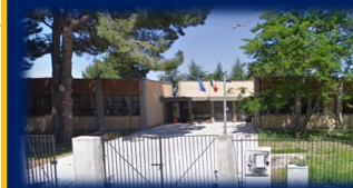
SEDE DI SIDERNO