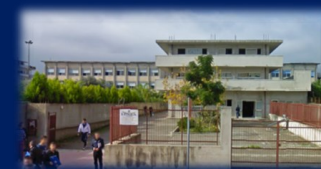
SEDE DI LOCRI