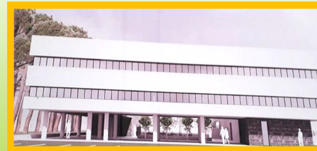
Sede nuovo Plesso Locri (accanto allo Stadio Comunale)